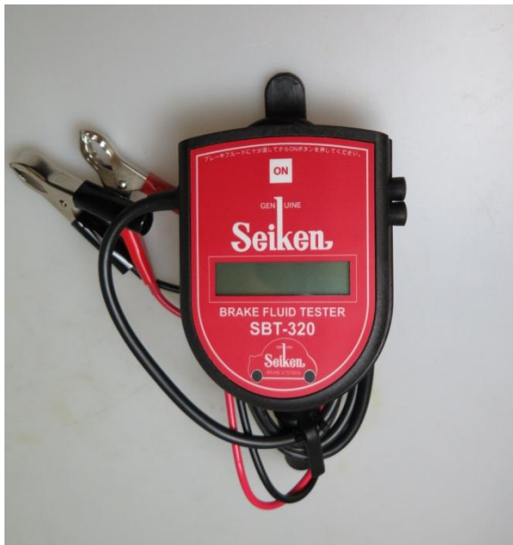
Seikenブレーキフルードテスター 品番：902-00320 販売価格：オープン