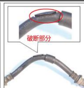
<ブレーキホースの破断事例>