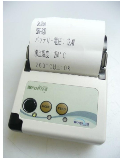
専用プリンター（受注生産品） テスター本体とセット販売 品番：903-00320 販売価格：オープン

裏面の国土交通省自動車局からのブレーキに関するプレスリリース（お知らせ）をご覧ください。