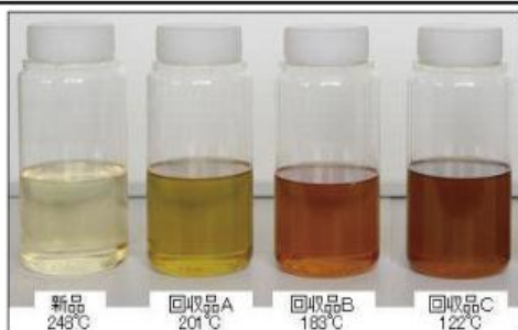
<使用過程車から回収したブレーキ液の沸点>

ブレーキホース等については、亀裂や損傷がないか、定期点検（マイナーの場合は1年ごと）をはじめ、適切な点検により容易に発見できるので、整備工場等で確実に点検しましょう。